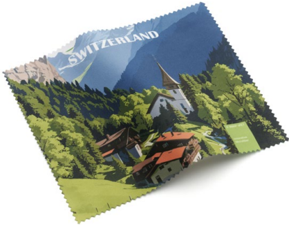
Ansicht des fertigen Brillentuchs